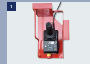
1 Joystick (Hangcha)