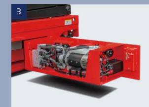
3 Hydraulisches und elektrisches System