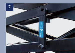
7 Stützarme: Zum Schutz des Bedieners bei Reparatur- und Wartungsarbeiten