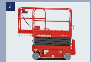
2 Plattform mit Auszug