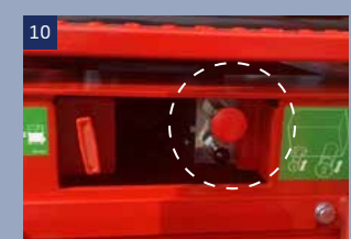
10 Manuelles Freigabe-Ventil. Wenn die Fahrfunktion der Plattform nicht reagiert, kann die Plattform nach betätigen des Ventils manuell verfahren werden