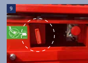
9 Manuelles Absenkenventil: Selbst bei niedrigem Batteriestatus oder Versagen der Steuerung lässt sich die Bühne mit diesem manuellen Absenkenhebel immer noch absenken