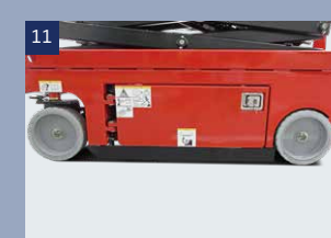
11 Ein automatischer Kippschutz greift ein, sobald bei einem Hub oberhalb von 2 m auf unebenem Grund Bewegungen stattfinden