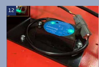
12 Neigungssensor: beim Heben und Fahren an einem Gefälle, prüft der Sensor automatisch den Neigungswinkel der Maschine, wenn die Neigung größer ist als der Nennwinkel, löst der Alarm für den Bediener aus